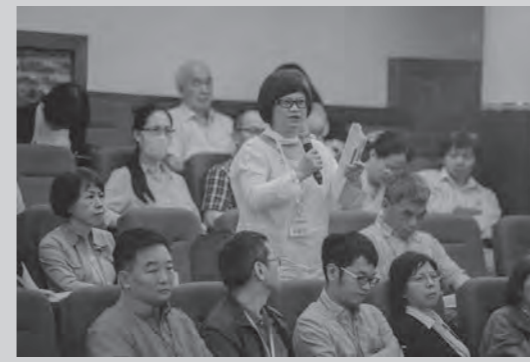
當天研討會最後的現場提問